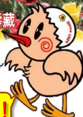
鴻巣市メインキャラクター 「ひなちゃん」